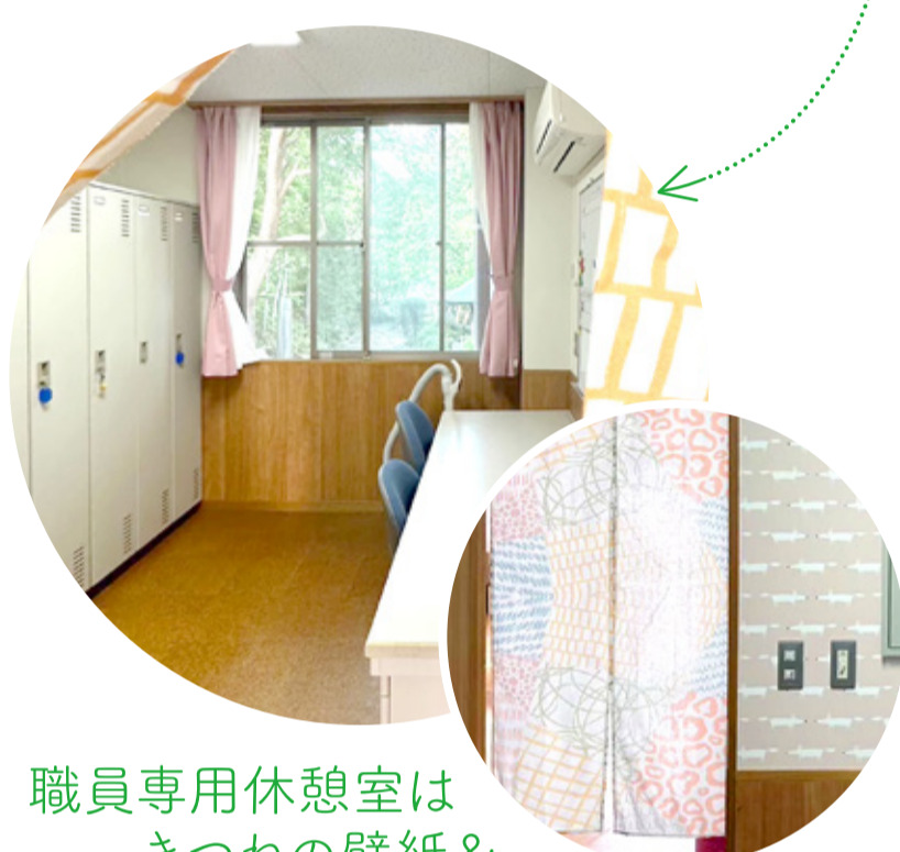
職員専用休憩室は きつねの壁紙& かわいいのれん