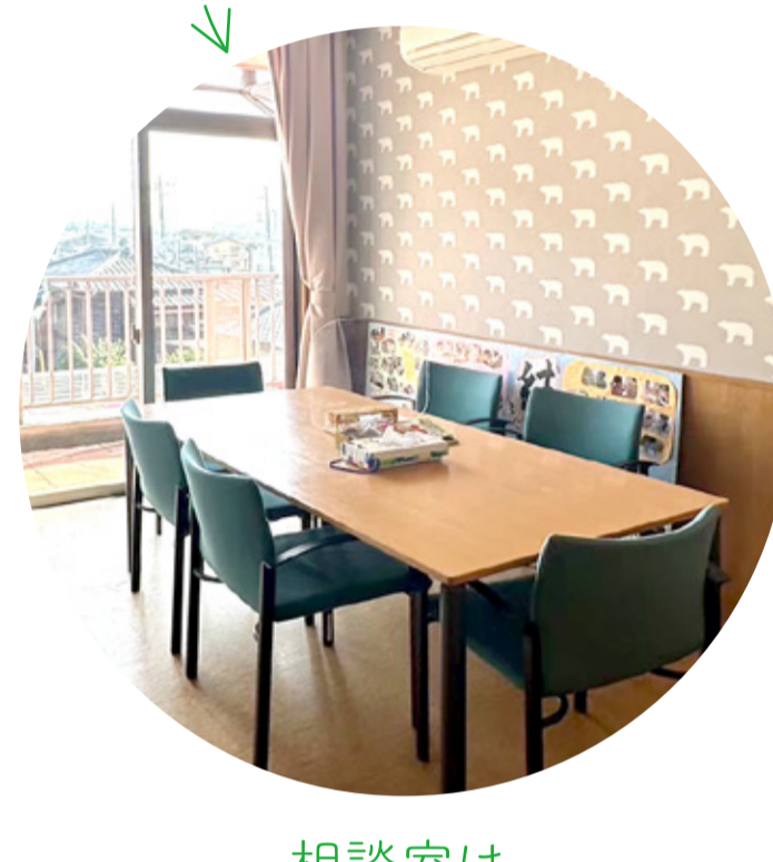
相談室は しろくまの壁紙