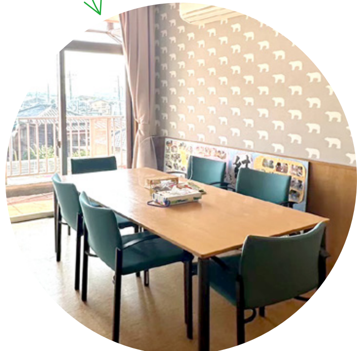
相談室は しろくまの壁紙