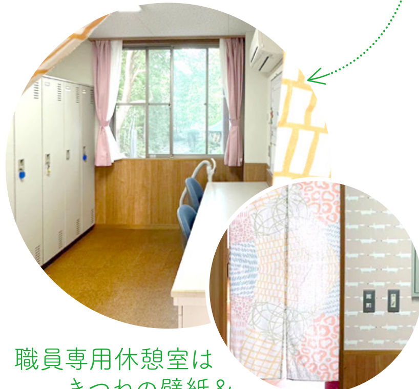
職員専用休憩室は きつねの壁紙& かわいいのれん