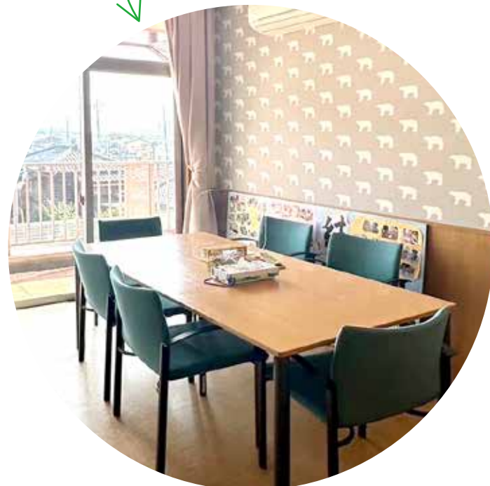
相談室は しろくまの壁紙