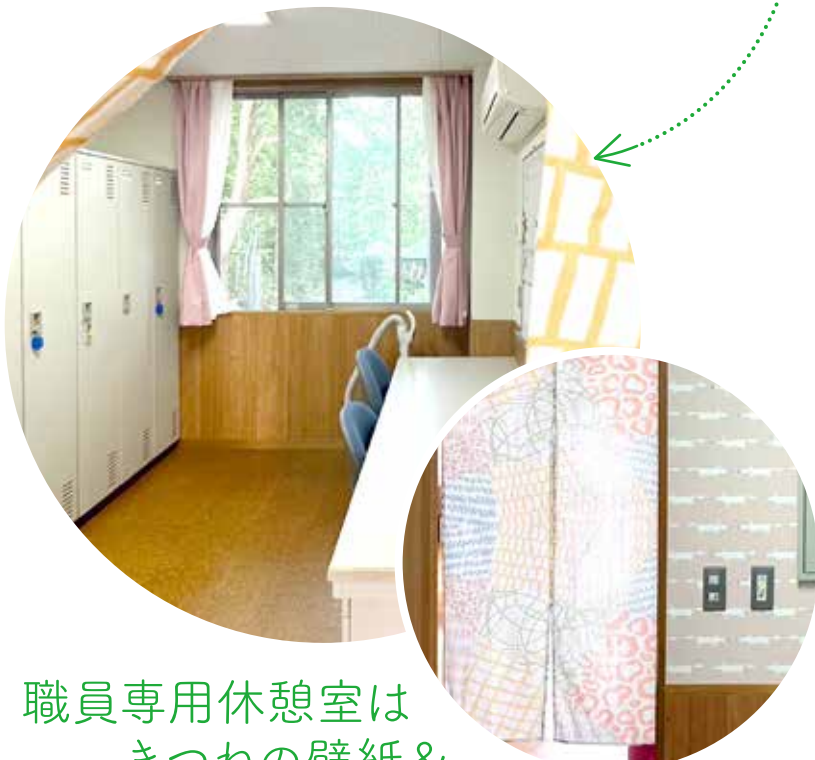
職員専用休憩室は きつねの壁紙& かわいいのれん